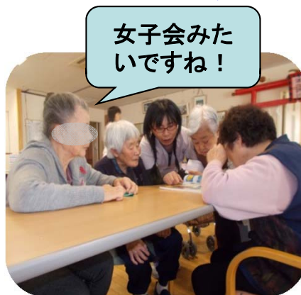
女子会みたいですね！