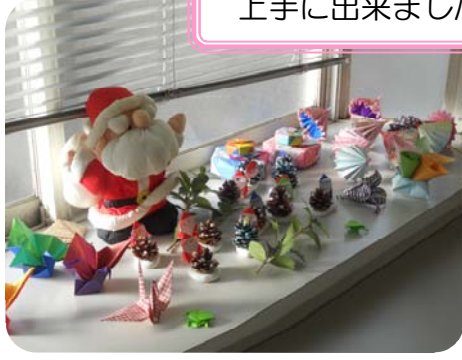
上手に出来ました