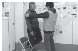
フレイルチェック