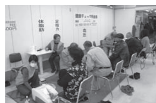
健康チェックコーナー