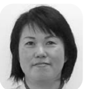
介護福祉士 (通所リハビリCoCoLo主任)