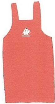
後は紐でなくボタンで留まります

医療生協さいたまでは、赤地にココロンがプリントされたココロンエプロンの販売を始めました。組合員価格は一四六〇円です。申し込みはお近くの運営委員まで、日曜大工のお父さんにもびったり。