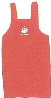
後は紐でなくボタンで留まります

医療生協さいたまでは、赤地にココロンがプリントされたココロエプロンの販売を始めました。組合員価格は一四六〇円です。申し込みはお近くの運営委員まで、日曜大工のお父さんにもぴったり。