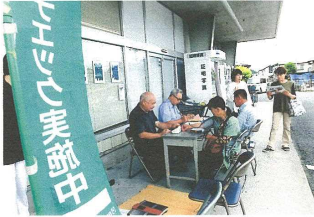
梅雨時の小雨ふる健康デー、ここでの次回8月23日の天候はどうでしょうか？

この日は、秩父生協病院から総看護長に参加していただき、チェックの結果について細かく説明していただきました。