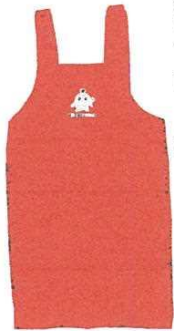
後は紐でなくボタンで留まります

医療生協さいたまでは、赤地にココロンがプリントされたココロンエプロンの販売を始めました。組合員価格は一四六〇円です。申し込みはお近くの運営委員まで、日曜大工のお父さんにもぴったり。