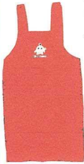
後は紐でなくボタンで留まります

医療生協さいたまでは、赤地にココロンがプリントされたココロンエプロンの販売を始めました。組合員価格は一四六〇円です。申し込みはお近くの運営委員まで、日曜大工のお父さんにもぴったり。