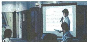
平和集会で広島で開かれた 世界大会へ参加した職員の 報告