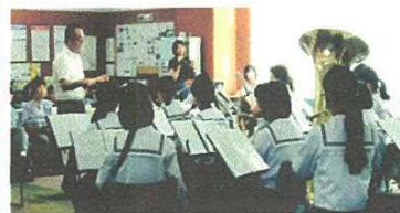
高篠中学校音楽部の吹奏楽 の演奏