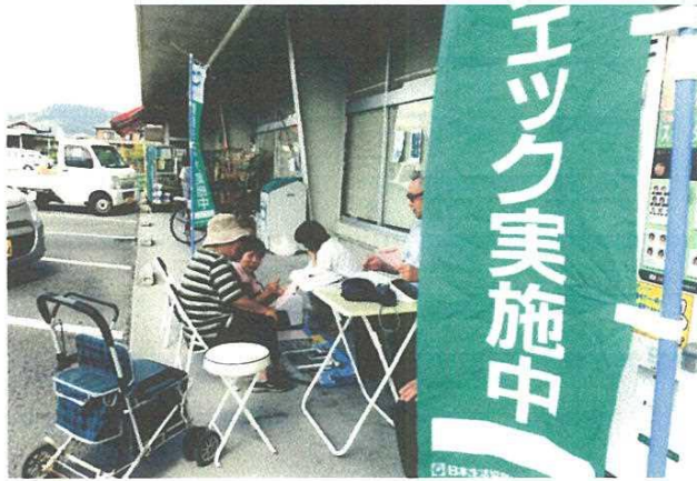
秩父生協病院から参加してくれた看護師さんの丁寧な結果説明が好評でした。