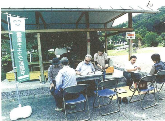
雨模様の龍勢茶屋の前庭、骨の硬さの測定もありました

十月の健康デーは やおよし小鹿野店で 十月の健康デーを、十八日(木)に、 やおよし小鹿野店をお借りして、午前十