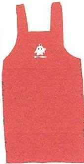
後は紐でなくボタンで留まります

医療生協さいたまでは、赤地にココロンがプリントされたココロンエプロンの販売を始めました。組合員価格は一四六〇円です。申し込みはお近くの運営委員まで、日曜大工のお父さんにもぴったり。