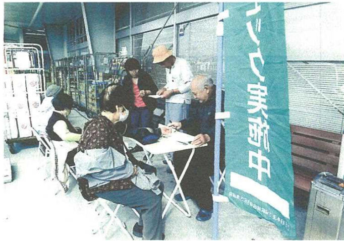
気持ち良い秋空の下、やおよし小鹿野店での健康チェック

十月の健康デーを十八日に、やおよし小鹿野店をお借りしておこないました。心配されていた天候も回復し、買い物客など六人の健康チェックができました。