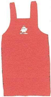
後は紐でなくボタンで留まります

医療生協さいたまでは、赤地にココロンがプリントされたココロンエプロンの販売を始めました。組合員価格は一四六〇円です。申し込みはお近くの運営委員まで、日曜大工のお父さんにもびったり。