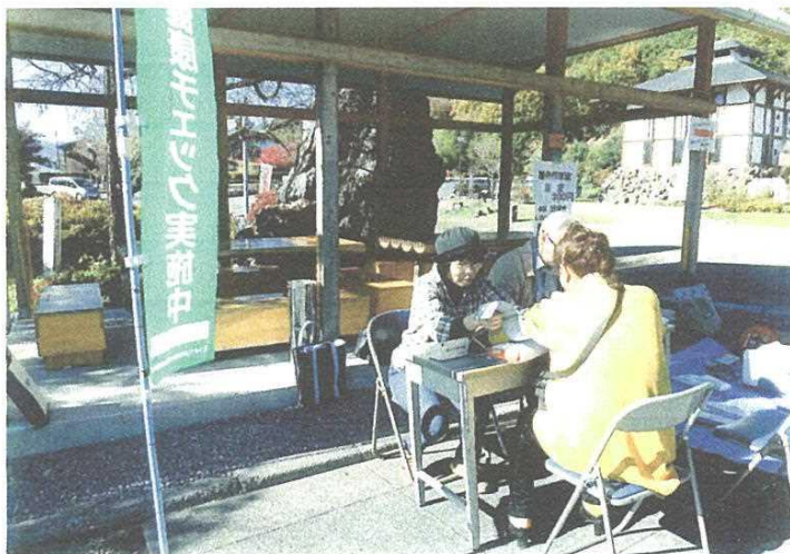
龍勢茶屋の庭に出来た東屋は、健康チェックの絶好の場所です

十一月の健康デーを、十五日に龍勢茶屋をお借りして午前十時からおこないました。行楽日和となったこの日、主に観光客七人の健康チェックができました。