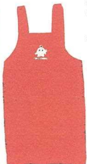
後は紐でなくボタンで留まります

医療生協さいたまでは、赤地にココロンがプリントされたココロンエプロンの販売を始めました。組合員価格は一四六〇円です。申し込みはお近くの運営委員まで、日曜大工のお父さんにもぴったり。