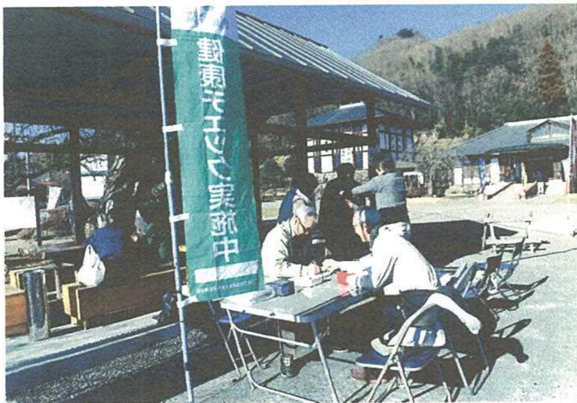
元気に始めました。今年初めての健康デー

この日も「支部ニュースを見て来ました」という組合員さんが見え、私たちも元気をもらいました。