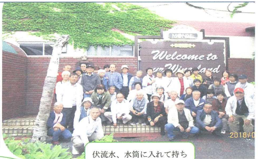
伏流水、水筒に入れて持ち帰りできます、ヒャッケー