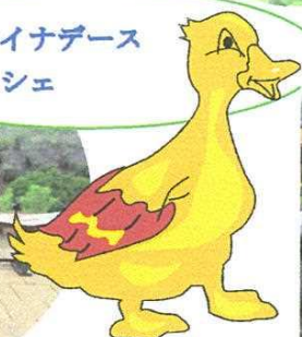
チャイナデース シエシエ