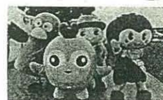
2016年度の着ぐるみ集合写真