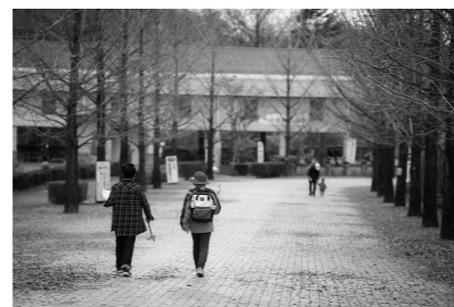
葉が散っても風情のあるイチョウ並木

今年、医療生協さいたまは誕生してから30周年を迎えました。様々な記念企画が各地で開催されていますが、その中の1つであるウォークイベントは、県内の18ヶ所で開催され、多くの参加者を集めることができました。