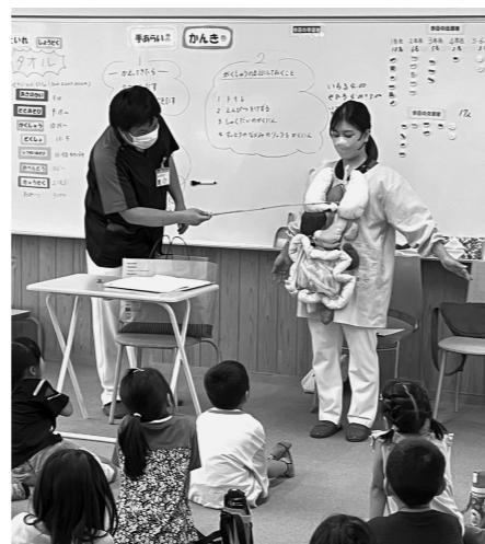
学童での保健教室

“内臓君”は学習会の出番をお待ちしております。興味をお持ちの方は、秩父生協病院（23-8124）までご連絡下さい。