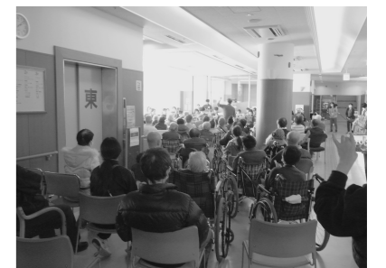
エレベーター前までぎっしりの人出