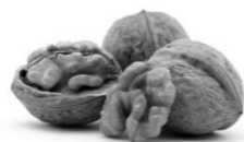
くるみそば汁 150ml あたりの栄養価 エネルギー：58kcal 塩分 2g