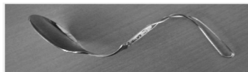
①曲げ曲げハンドル