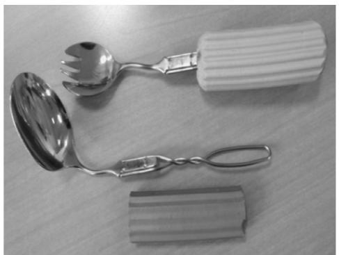
②スポンジハンドル