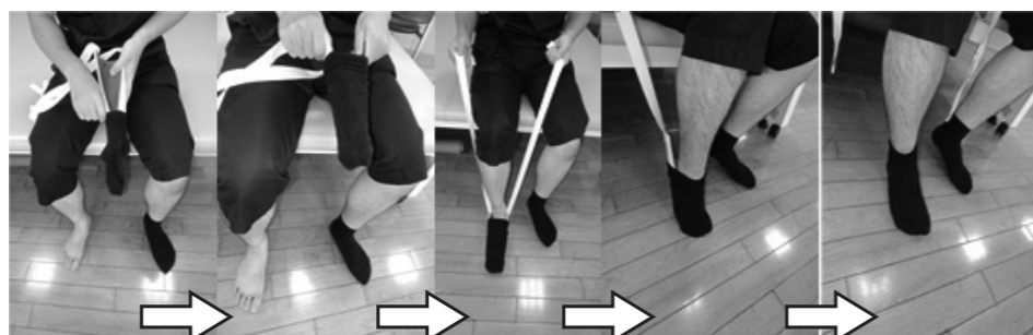
ソックスエイドの使い方

ソックスエイドの使い方ですが、下の写真のようにソックスエイドに靴下を履かせ、足先に下ろし、足を通して引っ張ることで靴下を履くことができます。