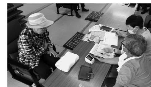
和室でじっくり健康相談