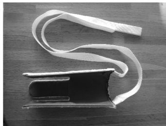
①市販のソックスエイド

第3回は、“更衣”に関する自助具『ソックスエイド』を紹介します。ソックスエイドは、足先まで手が届かなくなってしまった方が、手を借りずに靴下を履くことができるようにサポートする自助具です。腰を曲げて前かがみになることなく椅子などに座ったまま楽な姿勢で靴下がはけます。