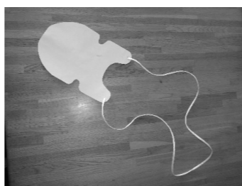
②手作りソックスエイド