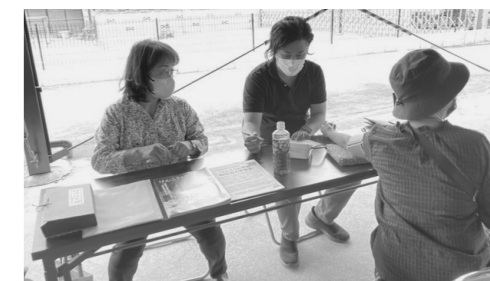
屋外で開放的に健康チェック