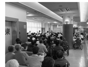
待合室ホールの端から端までびっ しり。奥の方にも人がいます