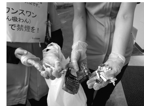
今回の成果(?) たった100m程度の区間なのに、トホホ…な量でした。

秩父生協病院では、禁煙外来を実施しています。禁煙したい気持ちはあるけれど、なかなか続かないという方は、是非、一度、ご相談下さい。