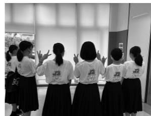
吹奏楽部で揃えたTシャツ