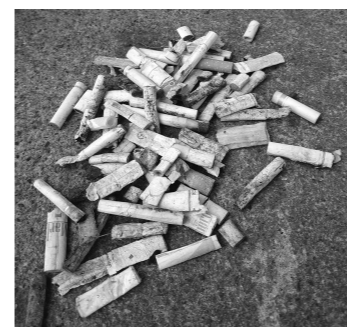
こちらは前月拾った吸い殻。集めきったつもりでした。