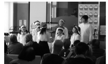
ちちぶ児童合唱団。お揃いのサンタ帽で登場

冒頭に、ちちぶ児童合唱団のこども達が、かわいい歌声を披露し てくれました。昨年に続き2回目の登場ですが、思わず「団員の みなさん！1年間でものすごく成長されました?!」と言いたくなる ほど、見事なパフォーマンスでした。曲数も増え、曲に合わせた 振り付けもあり、3歳の団員の指揮でみんなが歌う場面もあり… 会場が一気に明るくウキウキした雰囲気になりました。