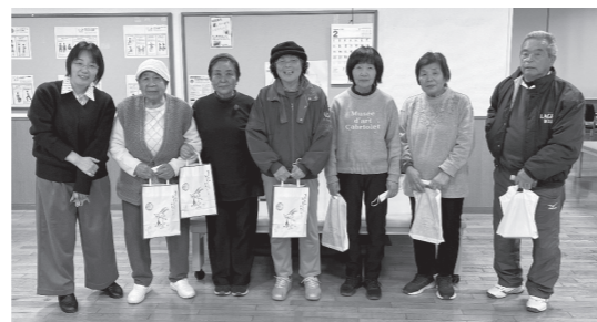
優勝チームと準優勝チーム