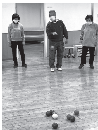
行まいにも強者感…

2月に6回目となる親善ボッチャ大会を開催しました。エントリーは、組合員と職員ととりまぜて20チームです。